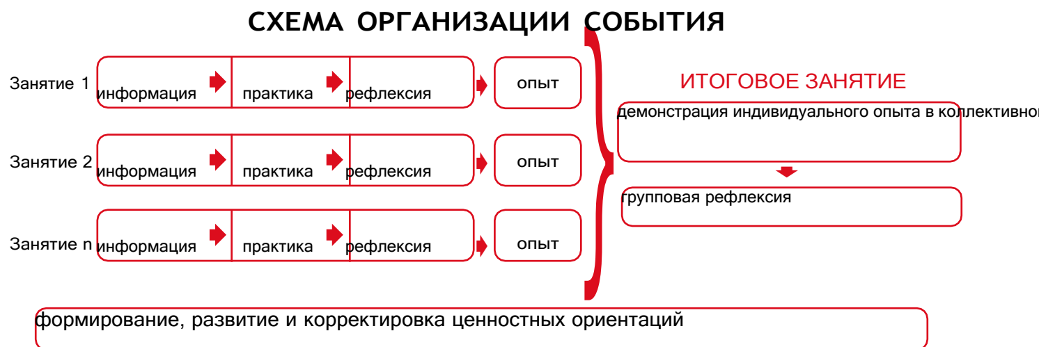
Рисунок 1 — Схема организации события

Таким образом, у пятиклассников происходит построение логической цепочки от собственного опыта проживания каждого занятия к ознакомлению с опытом других детей и к формированию общего отношения классного коллектива к прожитому ими событию.